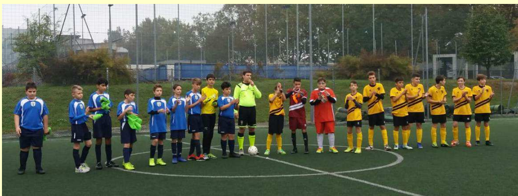
Under 15 – Atletico – Agnelli

Amine inizia alla grande con una doppietta, al 2' finalizza con un sinistro preciso e sicuro da posizione centrale un contropiede tre contro uno iniziato da Jack ed al 5' è interprete di una bella triangolazione con Matteo chiusa in tap-in sotto misura, come da manuale.