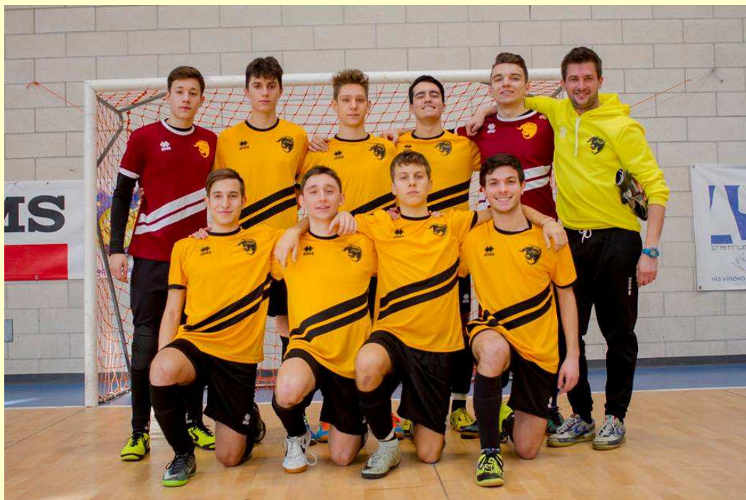
Under 21 di Mr. Battaglia

Che la partita sarebbe stata approcciata morbidamente era chiaro fin dal riscaldamento e nonostante si giocasse al piccolo trotto, senza nessun tipo di pressione o di corsa forsennata i ragazzi la sbloccano su punizione. Si sperava fosse la molla per cambiare passo ma in pochi minuti un assist di Sardo per l'avversario e una deviazione di Garrone su tiro laterale mettono la partita sul 1-2. Reazioni 0 e avversari con la possibilità di dilagare su errori marchiani fino all' 1-5 in circa 23 minuti. Qui però qualcosa scatta e finalmente si vedono dei passaggi giusti sul tappeto verde, due triangolazioni concluse male ma che danno fiducia. si va la riposo sull'1- 5.