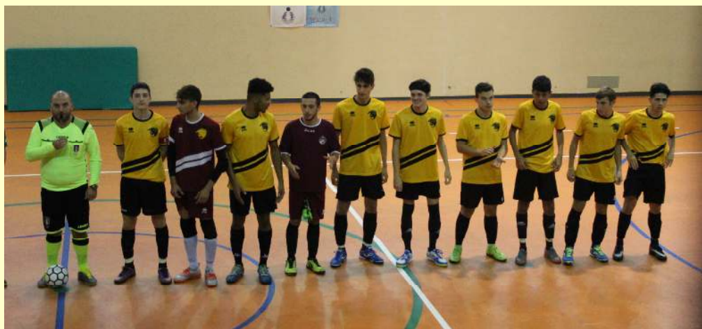
Under 19

Al 5', azione sulla sinistra di Simo che si libera del proprio marcatore; va al tiro, colpisce il palo a portiere battuto con la palla che rientrando in campo finisce sui piedi di Fede che a porta vuota manca il tap-in.