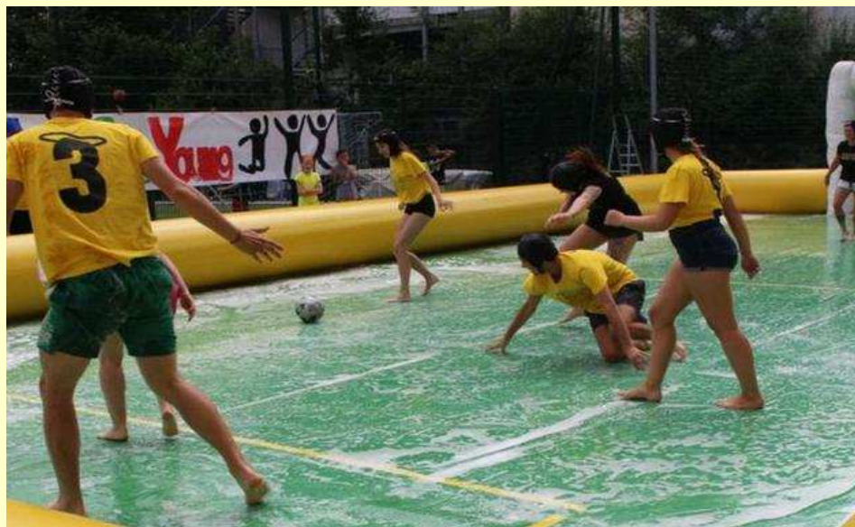
Calcio Saponato al Palatucci

Mentre le squadre si riscaldano camminando sulle uova.