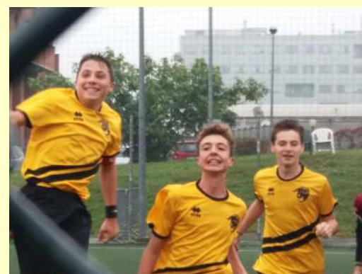
Saluto al pubblico