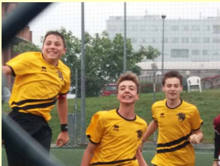
Esultanza finale – Under15 C5 REG

Facile per l'Under15 di Dany contro Agnelli Vince pattinando la nostra prima squadra in casa contro Caselle Sconfitte per Under17 – Under19 e Under21